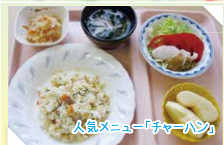
人気メニュー「チャーハン」