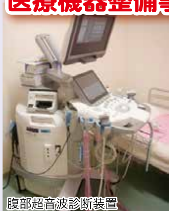
腹部超音波診断装置